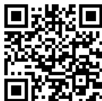
Настанова щодо встановлення та налаштування