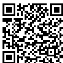
oLoader II (Android)

ЗАСТОСУНКИ ДЛЯ МОБІЛЬНИХ ПРИСТРОЇВ ТА ПК: